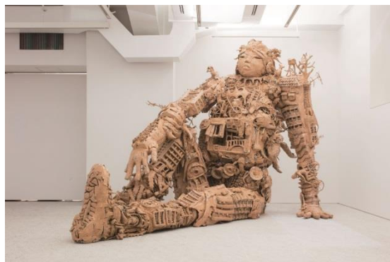
【右 図6】関口光太郎《サンダーstorm・チャイルド》2014年 新聞紙、ガムテープ、木、針金 315×240×470cm