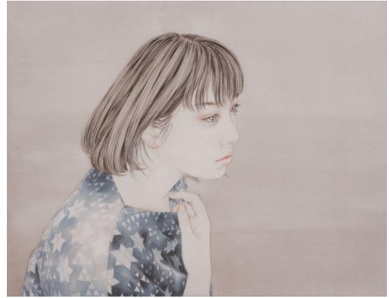
【右 図2】 やちだけい《初恋からかぞえて》2017年 パネルにアートクロス、墨、アクリル絵の具 31.8×41.0cm