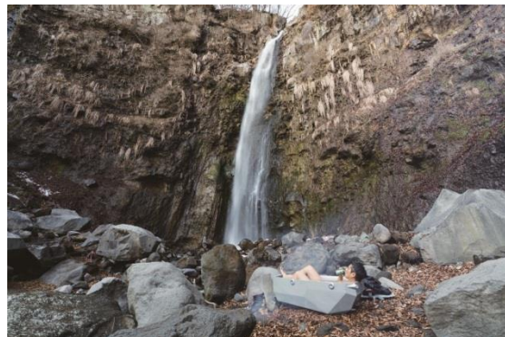
【右 図8】八木隆行《B3 project 赤城》2017年 ミクストメディア