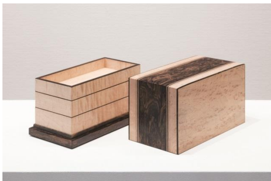
【左 図7】林哲也《楓鳥眼空造箱》2013年 技法：指物、象嵌、蠟仕上 素材：楓、シャム柿、神代杉 23×12×14cm