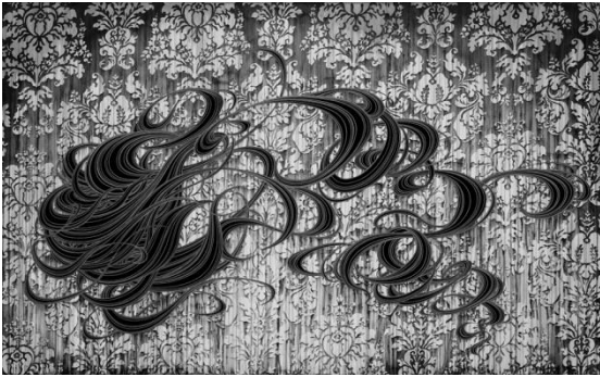
【左 図1】 ましもゆき《浮雲》2015年 インク、パネルに紙 81×117cm 撮影：Kei Okano