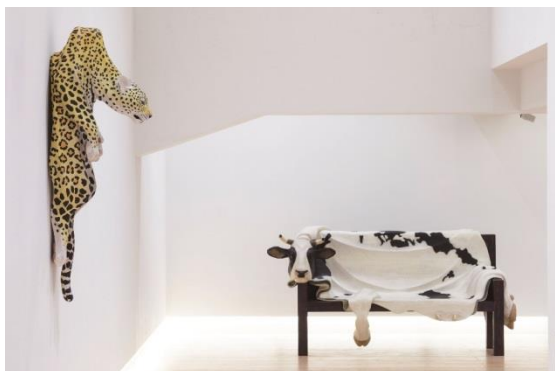
【左 図5】大島康幸《FAKE FUR 2004 -hang on the sofa-》2004年 楠、榎、着彩 120×232×100cm