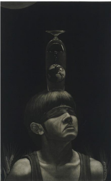
【左 図3】 多胡宏《僕等の星》2012年 メゾチント 60×37.5cm