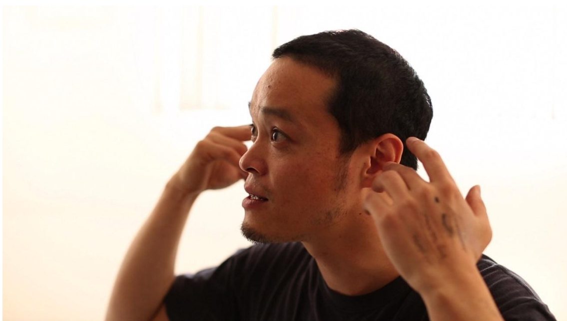
小泉明郎 ポートレート写真

1976年群馬県邑楽郡生まれ。横浜市在住。1999年国際基督教大学卒業。その後、チェルシー・カレッジ・オブ・アート・アンド・デザイン(ロンドン)にて映像表現を学ぶ。アーカスプロジェクト2003(茨城)、ライクスアカデミー(アムステルダム)等、国内外で滞在制作し、映像やパフォーマンスによる作品を発表している。主な個展に「Project Series 99: Meiro Koizumi」ニューヨーク近代美術館（2013年）、「Stories of a Beautiful Country」Centro de Arte Caja de Burgos[CAB]（ブルゴス/スペイン、2012年）、「MAM Project 009：小泉明郎」森美術館（東京、2009年）ほか、「フューチャー・ジェネレーション・アート・プライズ2012」ピンチュック・アートセンター（キエフ/ウクライナ、2012年）、「インビジブル・メモリー展」原美術館（東京、2011年）、「リバプール・ビエンナーレ2010」（2010年）、「メディア・シティ・ソウル2010」（2010年）、「第1回あいちトリエンナーレ」（2010年）などに参加。2012年には上毛芸術文化賞を受賞している。